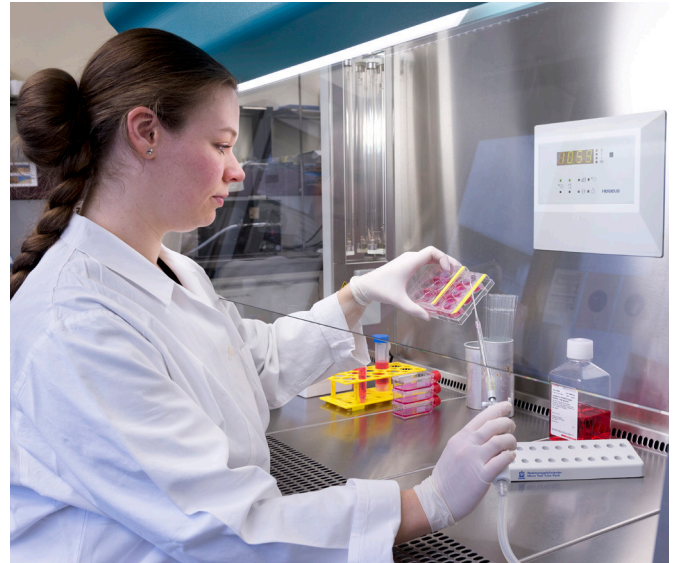
Forschende arbeitet mit Zellproben in der Sterilbank.