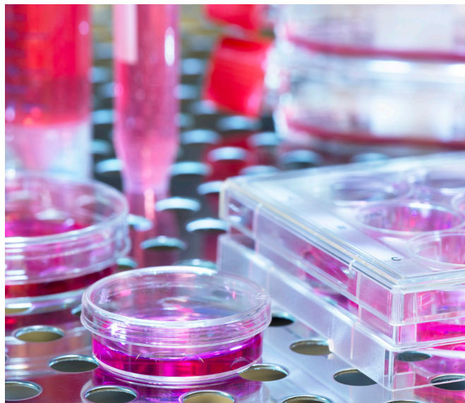
Zell- und Gewebeprobe in 37 °C-Inkubator.

In allen Bereichen der grundlegenden wie auch der angewandten biomedizinischen Forschung spielen experimentelle Untersuchungen an lebenden menschlichen und tierischen Zellen (zellbasierte Assays) eine herausragende Rolle. Die aus den verschiedenen Organen und Geweben des Körpers isolierten und im Labor kultivierten Zellen erlauben Experimente an lebenden Modellsystemen im Hochdurchsatz, ohne dafür auf Versuchstiere zurückgreifen zu müssen. Die Einsatzgebiete zellbasierter Assays reichen von biomedizinischen Fragestellungen über Wirkstoffentwicklung und Toxizitätsprüfung bis zu personalisierter Medizin.